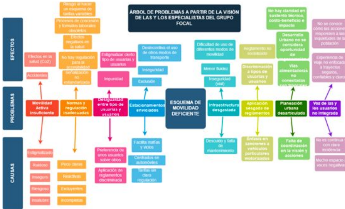
Árbol de problemas derivado del Grupo Focal

Con base en el análisis presentado, se tomaron las recomendaciones de acción para transformar la movilidad de la Ciudad de México, expresadas por las y los especialistas participantes del Grupo Focal, y se generó un árbol de problemas 1 que refleja de forma puntual las problemáticas visibilizadas a través de este espacio participativo.