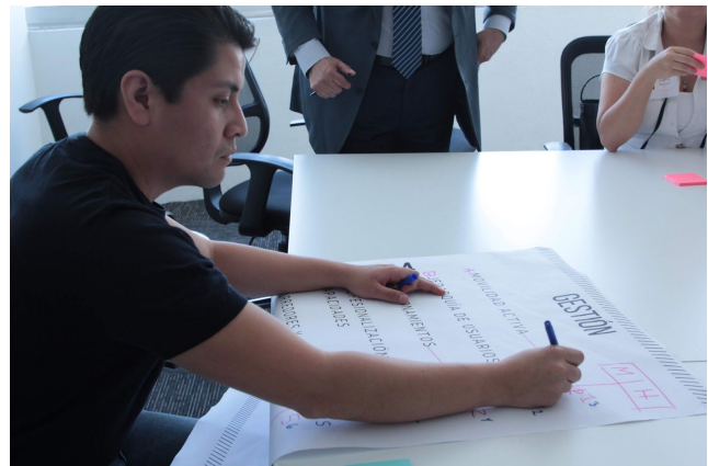
Referencia fotográfica del Grupo Focal Fuente: SEMOVI (2019)

Para lograr los objetivos señalados anteriormente, las actividades se dividieron en dos componentes estratégicos: